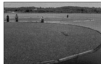
Preiselbeeren werden für Marmelade gesammelt