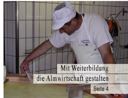
Mit Weiterbildung die Almwirtschaft gestalten