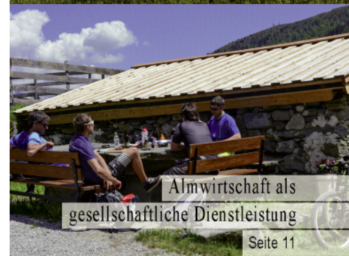
Almwirtschaft als gesellschaftliche Dienstleistung