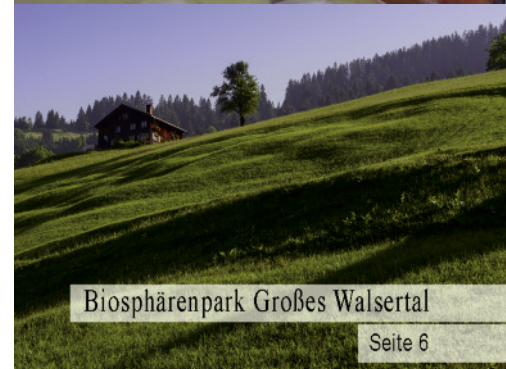
Biosphärenpark Großes Walsertal