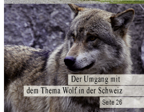
Der Umgang mit dem Thema Wolf in der Schweiz