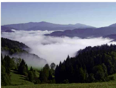
Titelbild: Blick vom Eibl ins Traisental/NÖ.