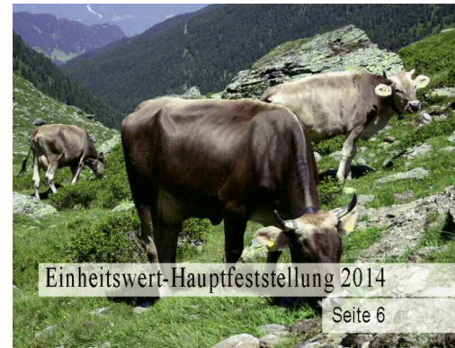
Einheitswert-Hauptfeststellung 2014 Seite 6

Bild Rückseite innen: Auf der Pfeisalm im Karwendel.