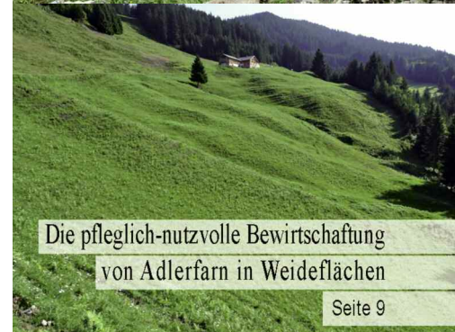
Die pfleglich-nutzvolle Bewirtschaftung von Adlerfarn in Weideflächen Seite 9