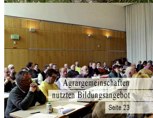
Agrargemeinschaften nutzen Bildungsangebot Seite 23

alm-at Impressum Medieninhaber und Verleger: Almwirtschaft Österreich, 6010 Innsbruck, Postfach 73, Tel.: 0680 / 117 55 60, Internet: www.almwirtschaft.com; ZVR: 444611497 | Herausgeber: Almwirtschaft Österreich, vertreten durch Obmann LR Ing. Erich Schwärzler und GF DI Susanne Schönhart, 6010 Innsbruck, Postfach 73 | Redaktion, Layout: DI Johann Jenewein, 6010 Innsbruck, Postfach 73, Tel.: 0680 / 117 55 60 | Verbreitung: Die Fachzeitschrift mit 9 Ausgaben erscheint monatlich in einer Auflage von 6.800 Stück in ganz Österreich und dem benachbarten Ausland (mit einer Doppelfolge im Winter und zwei Doppelfolgen im Sommer) | Preis für ein Jahresabonnement 19,- Euro (Inland), 38,- Euro (Ausland) | E-Mail: johann.jenewein@almwirtschaft.com | Manuskripte: Übermittlung möglichst per E-Mail oder auf CD-ROM, Bildmaterial als Dia, Foto oder digital. Für die Fachartikel zeichnen die einzelnen Autoren verantwortlich. Namentlich gezeichnete Beiträge geben nicht unbedingt die Meinung von Redaktion und Herausgeber wieder. | Druck: Athesia-Tyrolia Druck Ges mbH, 6020 Innsbruck, Exlgasse 20; Tel.: 0512/282911-0 | Anzeigen: Tel.: 0680 / 117 55 60 oder E-Mail: johann.jenewein@almwirtschaft.com | 64. Jahrgang | Gedruckt auf chlorfrei gebleichtem Papier!