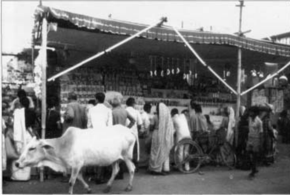
Die indische Kuh ist überall anzutreffen

Die Heiligkeit der indischen Kuh ergibt sich aus der Wertschätzung ihres Gebrauchs. Überall auf den Straßen Indiens ist die Heilige Kuh anzutreffen, anscheinend niemandem gehörend. Sie ernährt sich von Abfällen und Papier oder grast auf den spärlichen Grünflächen der öffentlichen Plätze. Auch auf stark befahrenen Straßen ist es keine Seltenheit und für die Inder eine Selbstverständlichkeit anzuhalten, um einer Kuh den Weg freizugeben. Diese kleinen Alltagssituationen sind für den Indienreisenden immer wieder aufs neue erstaunlich. Der uns unbekanntere rücksichtsvolle Umgang mit der Kuh befremdet. Lesen Sie dazu den Beitrag aus dem fernen Indien von Salome Wild.