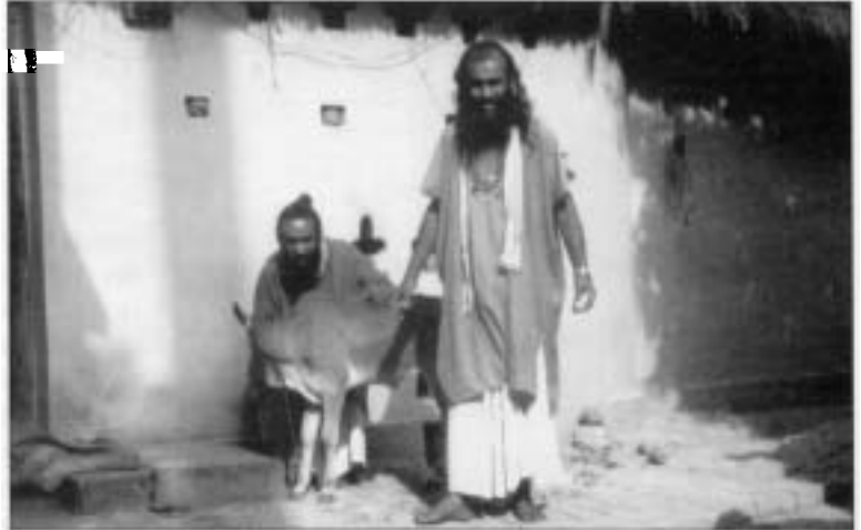
Der Teinpel kann auch gleichzeitig Viehunterstand sein

Im Hinduismus sind zwei Gebote bezüglich der Verehrung der Kuh wesentlich. Die eine Regel verbietet jegliche Gewalt gegenüber beseelt gedachten Lebewesen (Menschen, Tiere, Pflanzen aber auch Steine). Darin wurzelt auch das Fleisch- und Schlachtabu. Andererseits gibt es das konkrete Gebot der allgemeinen Rinderverehrung und im speziellen der Zebukuh. Da die Kuh dem Wohl des Menschen dient, wird sie als das Symbol der Fruchtbarkeit und des Lebens überhaupt betrachtet. In manchen ländlichen Gegenden ist der Tempel oder die Gebetsstätte gleichzeitig der Unter-