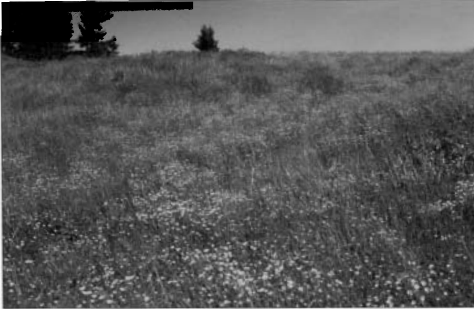
Die Form des Phosphateinsatzes hängt von der Bodenart ab

Phosphate (P) kommen im Boden sowohl anorganisch (Ortophosphate) als auch organisch gebunden in Mengen bis zu 2000 kg P/ha und mehr vor. Da nur ein geringer Teil der Phosphate im Boden pflanzenverfügbar ist und diese auch im Boden fixiert werden können, muss durch Kultur- und Düngungsmaßnahmen ständig versucht werden, den P-Vorrat laufend zu mobilisieren. Lesen Sie dazu nachstehenden Beitrag von Dipl.-HLFL-Ing. Josef Galler.