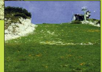
Nachher: mit ReNatura®

Kärntner Saatbau e. Gen. Kraßniggstraße 45 A-9020 Klagenfurt Tel. +43 (0)463/512208 Fax +43 (0)463/51220885