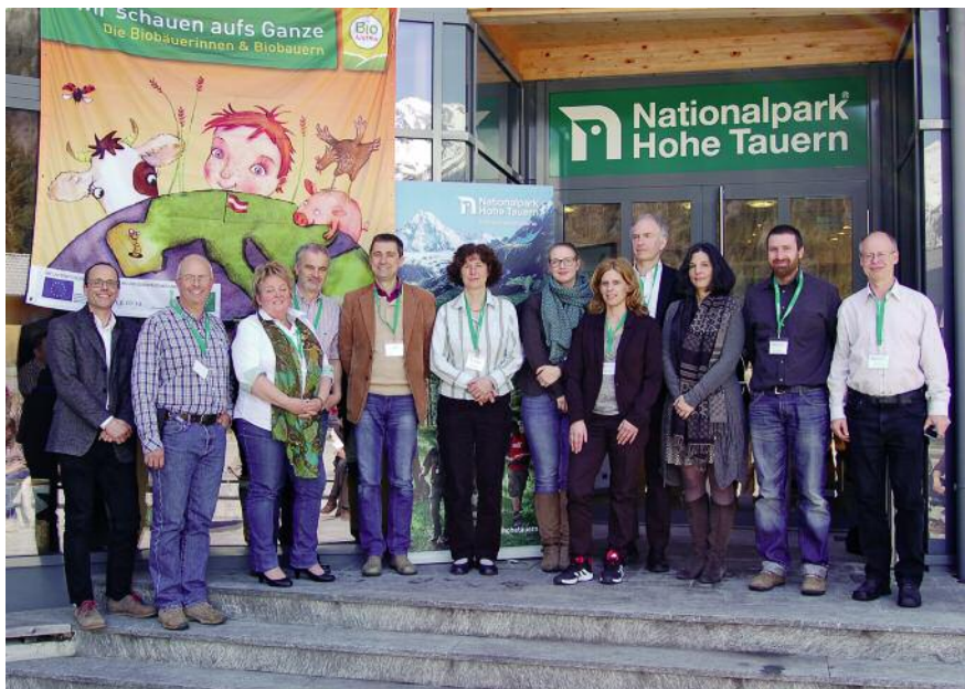
Die Referentinnen und Referenten der Landwirtschaftstagung in Mallnitz.

Bedeutung für Tourismus, regionaltypische Produkte und Verarbeitungsverfahren und damit die kulturelle Identität.