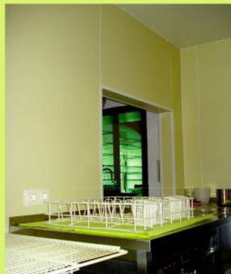
Küche: Wand, Decke, Küchenrückwand abwaschbar, fugenlos