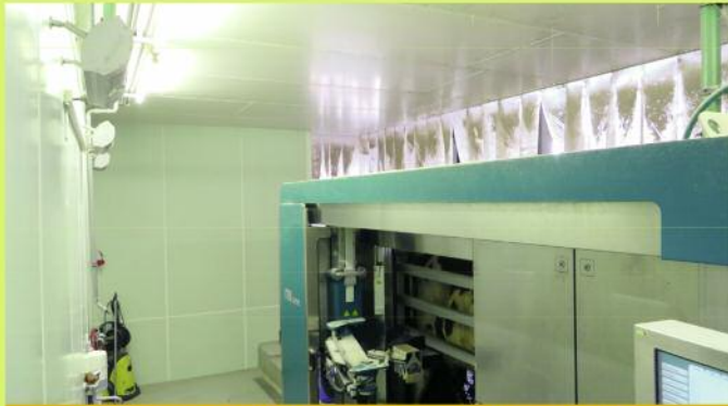
Milchbetrieb nachhaltig sauber und Säure-beständig

... Wohnbereich, Gewerbe- u. Wirtschaftsräume