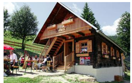
Der Landesalmwandertag findet heuer auf der Reisberger Halt statt.

Der diesjährige Landesalmwandertag findet auf der Saualpe statt. Diese ist ein Gebirgszug, welcher sich von Diex bis Klippitztörl erstreckt. Die Saualpe bietet familienfreundliche Wanderwege, landschaftlich attraktive und anspruchsvolle Rundwandertouren, urige Almhütten mit angeschlossener Almwirtschaft sowie einem Reitwegenetz. Den Ausgangspunkt des diesjährigen Landesalmwandertages bildet die Reisbergerhütte auf 1476 m Seehöhe.