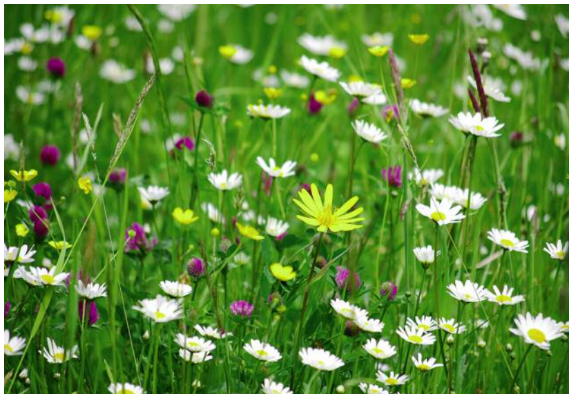
Die Gewinnung und Bedeutung des heilwirksamen Birkenbaumwassers (li.) wird in „Nahrhafte Landschaft 3“ ebenso behandelt wie der Wert einer artenreichen Wiese (re.).

wort: „Davon auszugehen, die Zeiten hätten sich geändert, ist eine zu einfache Interpretation und eröffnet stets die Möglichkeit, neue Märkte einzuführen. Die Wandlungen in der Kultur spitzen sich heute mehr denn je zu neuen Abhängigkeitsmechanismen zu und bedeuten Abstriche in der Autonomie. In den Jahrgängen zwischen 1920 und 1945 erarbeitete man noch Speisen und Heilmittel auf der Basis so mancher Sammelkräuter. Heute dazu befragt, erinnern sich nur wenige Leute daran, da sie vieles verdrängt haben. Auch die Gemüsegartenwirtschaft war in den Landgemeinde mit Ende der 1960er- bis 1970er-Jahre sukzessive eingestellt und durch die Ziergartenpflege ersetzt worden. Beinahe alle Bauernwirtschaften wurden in Landwirtschaften mit agroindustriellem Charakter umgewandelt. Die Generation, die das Wissen umfassend und im Sinne einer ökologischen Sparsamkeit auch lebte, ist mittlerweile ausgestorben.“