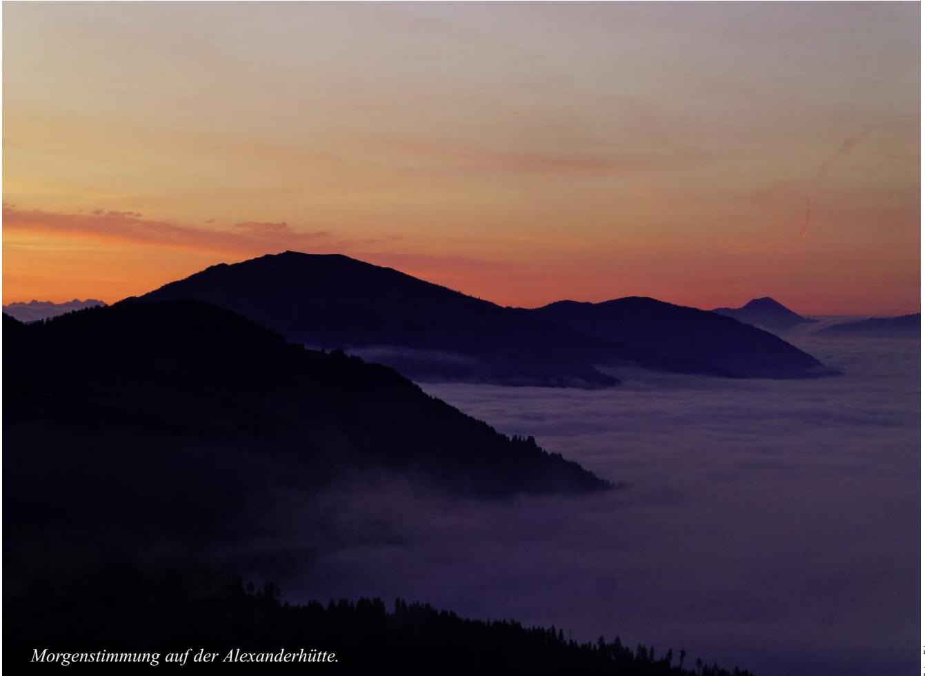
Morgenstimmung auf der Alexanderhütte.