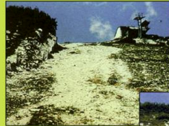
Vorher: ohne ReNatura®