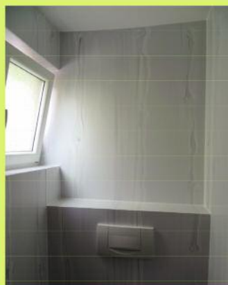
Sanierung Bad-WC - auch direkt über alte Fliesen