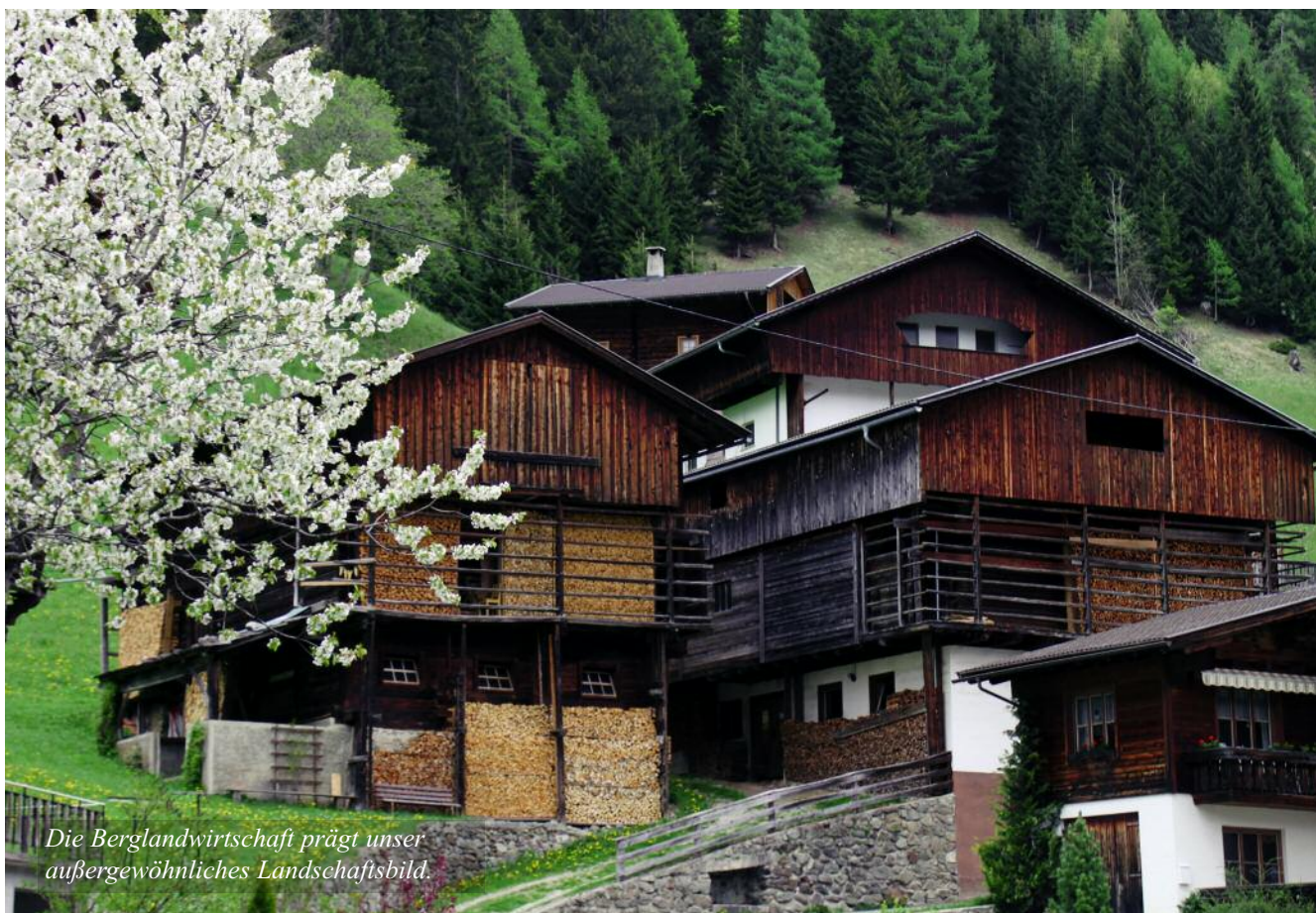
Die Berglandwirtschaft prägt unser außergewöhnliches Landschaftsbild.