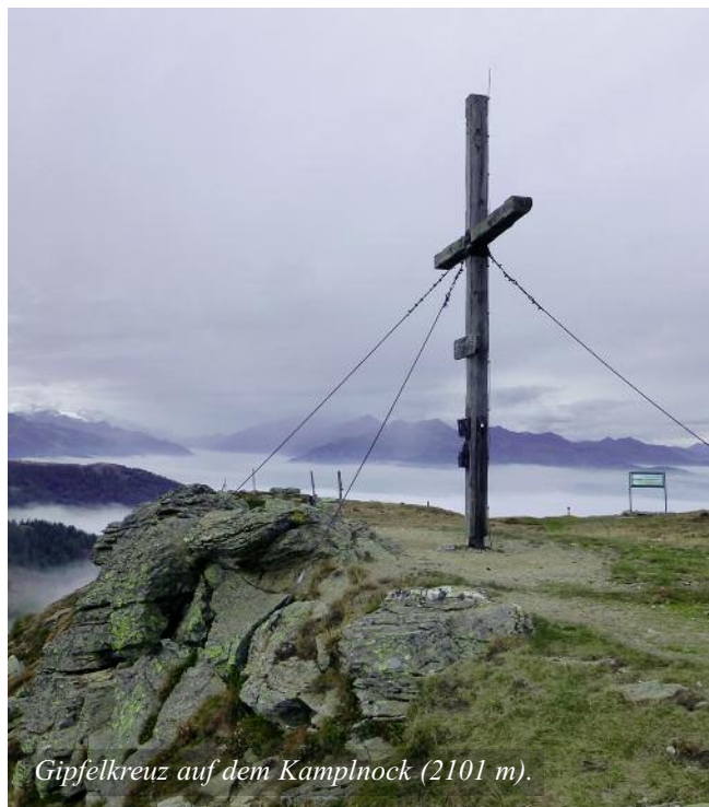
Gipfelkreuz auf dem Kamplnock (2101 m).

gehen, durch schöne Wälder und über blühende Almwiesen aufwärts, bis zur Sommeregger Hütte.