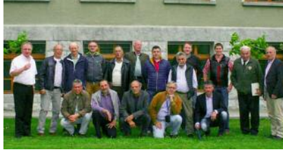
Die Vertreter der Berggrinderrassen trafen sich im Wallis.