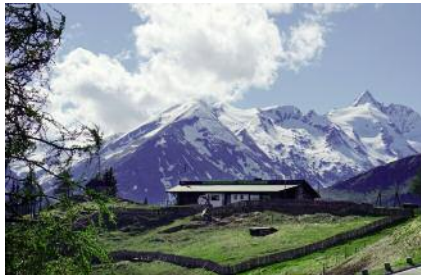
Die Alm Kasereck im NP Hohe Tauern in Heiligenblut.

Nur den Bergbäuerinnen und Bergbauern ist es zu verdanken, dass diese einmalige Almlandschaft über Generationen erhalten blieb. Die Erhaltung der Almen muss ein gesellschaftliches Anliegen sein. Möglich ist das nur mit viel Idealismus und der Liebe zur heimischen Landwirtschaft.