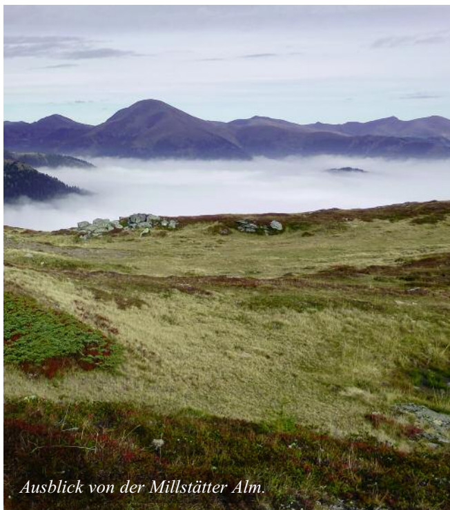
Ausblick von der Millstätter Alm.