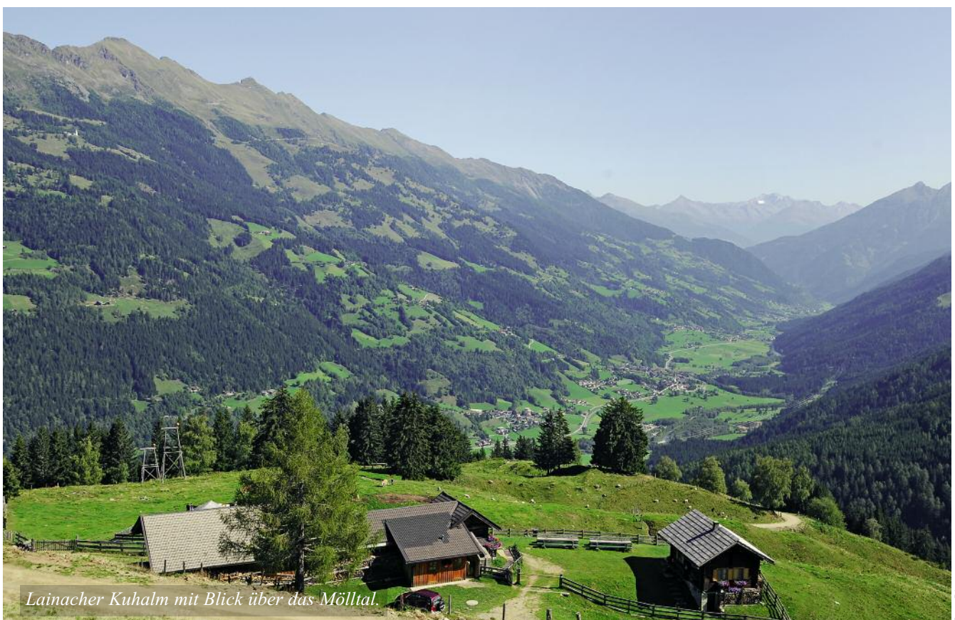
Lainacher Kuhalm mit Blick über das Mölltal.