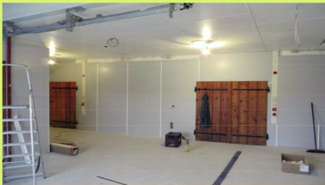
Lebensmittelrein - ohne Kondensationsfeuchte