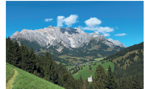
Ausblick von der Grüneggalm auf Dienten am Hochkönig