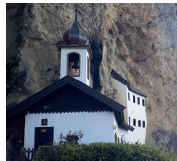
Einsiedelei am Palfen