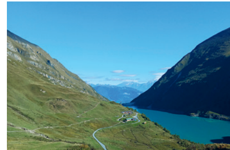
Blick vom Mooserboden zur Fürthermoaralm

Gehzeit: 45 Minuten (leichte Wanderung bergab)