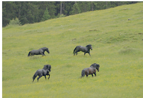
Hengstenauftrieb auf der Grieswiesalm