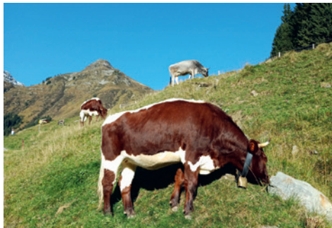
Rinder auf der Ossmannalm im Hintergrund der Tristkogel

Gehzeit: 3,5 h (leichte Wanderung über Almflächen talauswärts)