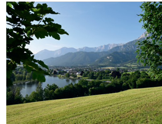
Tagungsort Saalfelden am Steinernen Meer

Anmeldeschluss: Donnerstag, 30. April 2026