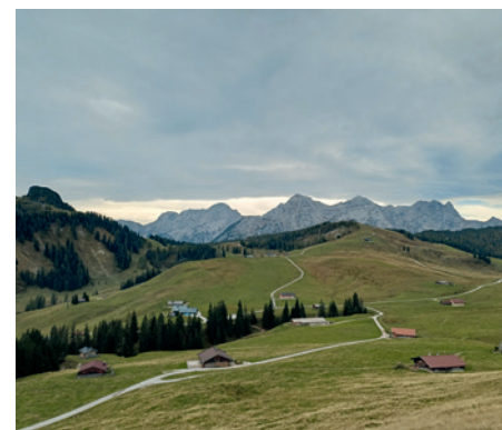
Ein Blick über das Almgebiet der Lofereralm