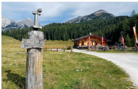
Die Kashüttln auf der Kallbrunnalm

Grenzüberschreitende Almen in Weißbach bei Lofer mit 30 Berechtigten aus Ramsau, Berchtesgaden und Weißbach. Kallbrunnalm: Rund 350 Tiere, gemeinsame Sennerei „Kashüttln“; Kammerlingalm: 11 Hütten, sehr steile Weideflächen. Gehzeit: 4 h (Forst- und Wanderwege)